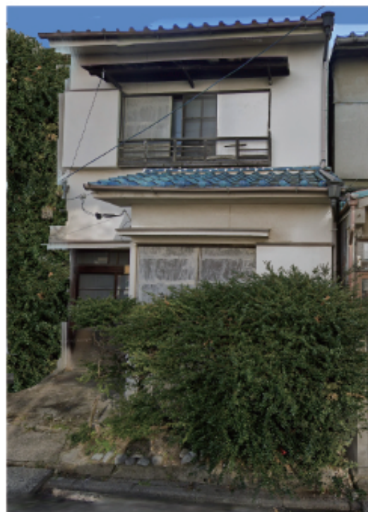
千成小学校・豊国中学校