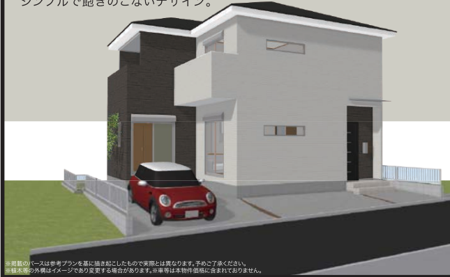
※掲載のイメージは参考プランを基に描き起こしたもので実際とは異なります。予めご了承ください。 ※植木等の外観はイメージであり変更する場合があります。※写真は本物件価格に含まれておりません。